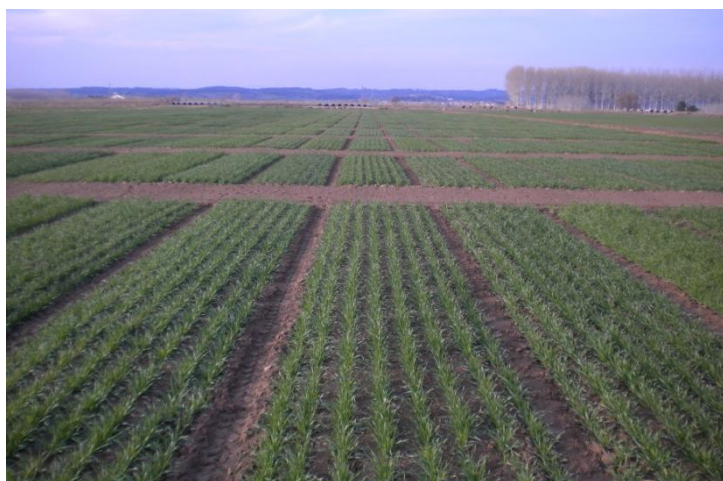
Figura 2.- Camp d'assaig de varietats de la campanya 2009-10 de la Tallada d'Empordà (el Baix Empordà).